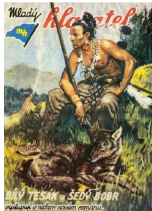
Obálka časopisu Mladý hlasatel - autor Bohumil Konečný – Bimba (1939)