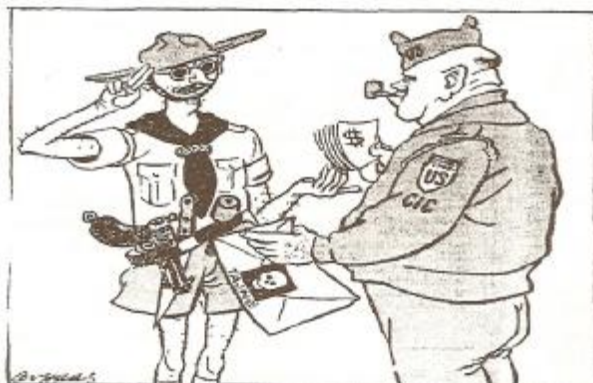
Ukázky karikatur skautů z tehdejšího tisku (50. léta)